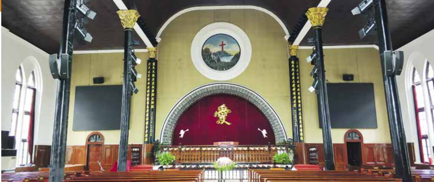
Caméras de surveillance dans une église officielle chinoise.