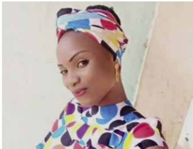
Les assassins de Deborah Samuel n'ont toujours pas été arrêtés.